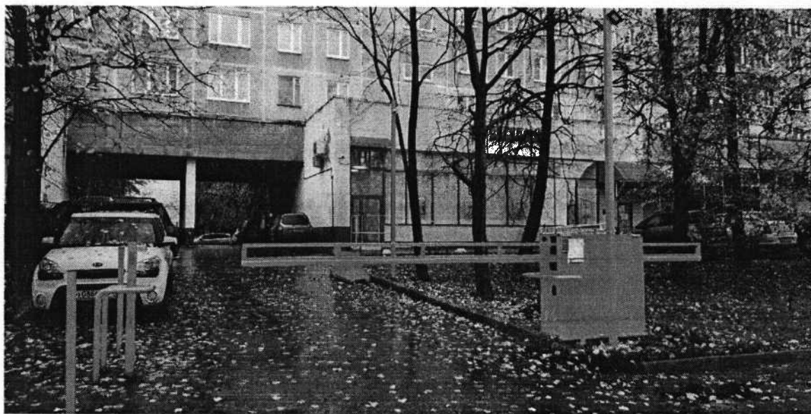
Рис. 2. Внешний вид шлагбаума и ответного столба

Дорожный откатной шлагбаум с автоматическим электромеханическим приводом отката стрелы. Шлагбаум состоит из металлической стрелы и стальной стойки, установленной на бетонное основание и закрепленной болтами, вмонтированными в бетонное основание. В стойке шлагбаума находится электромеханический привод, а также блок электронного управления. Привод, перемещающий стрелу, состоит из электродвигателя, скоростного мотора-редуктора. Шлагбаум снабжен регулируемым устройством безопасности, а также устройством фиксации стрелы в любом положении и ручным расцепителем для работы в случае отсутствия электроэнергии.