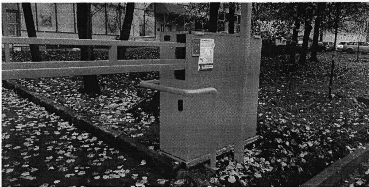
Рис. 4. Внешний вид шлагбаума

Шлагбаум состоит из металлической стрелы (несущий каркас из профильной трубы) серого цвета со светоотражающими наклейками, а также стальной тумбы, покрашенной полиэфирной краской оранжевого цвета, и ответного столба с датчиком. Шлагбаум и ответный столб защищены дополнительным усилением из металлической трубы, покрашенной полиэфирной краской оранжевого цвета.